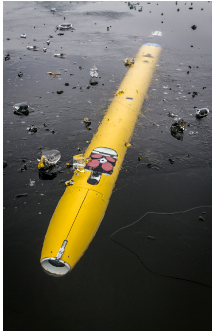
Das autonome Unterwasserfahrzeug Leng könnte eine kilometerdicke Eisdecke auf dem Jupitermond Europa durchdringen, unter der ein Ozean vermutet wird.

„Es ist davon auszugehen, dass sich fast alle Routinetätigkeiten automatisieren lassen – ganz gleich, ob es sich um körperliche oder geistige Arbeit handelt“, so Becker. „Das heißt aber nicht, dass der Mensch nicht mehr gebraucht wird.“ Auch Axel Weise, der Digitalisierungsexperte der